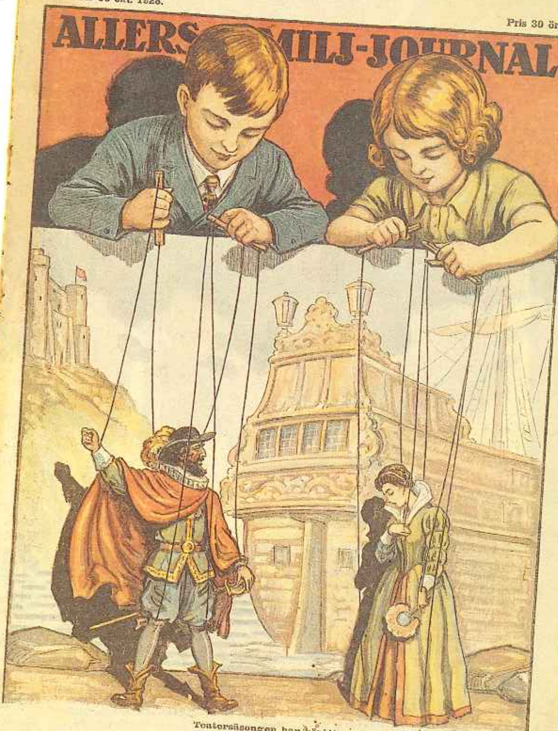
Teatersäsongen har börjatt.

da bakifrån med katthuvud" och "Riddar Hans med sitt avsvimmade jag under fötterna".