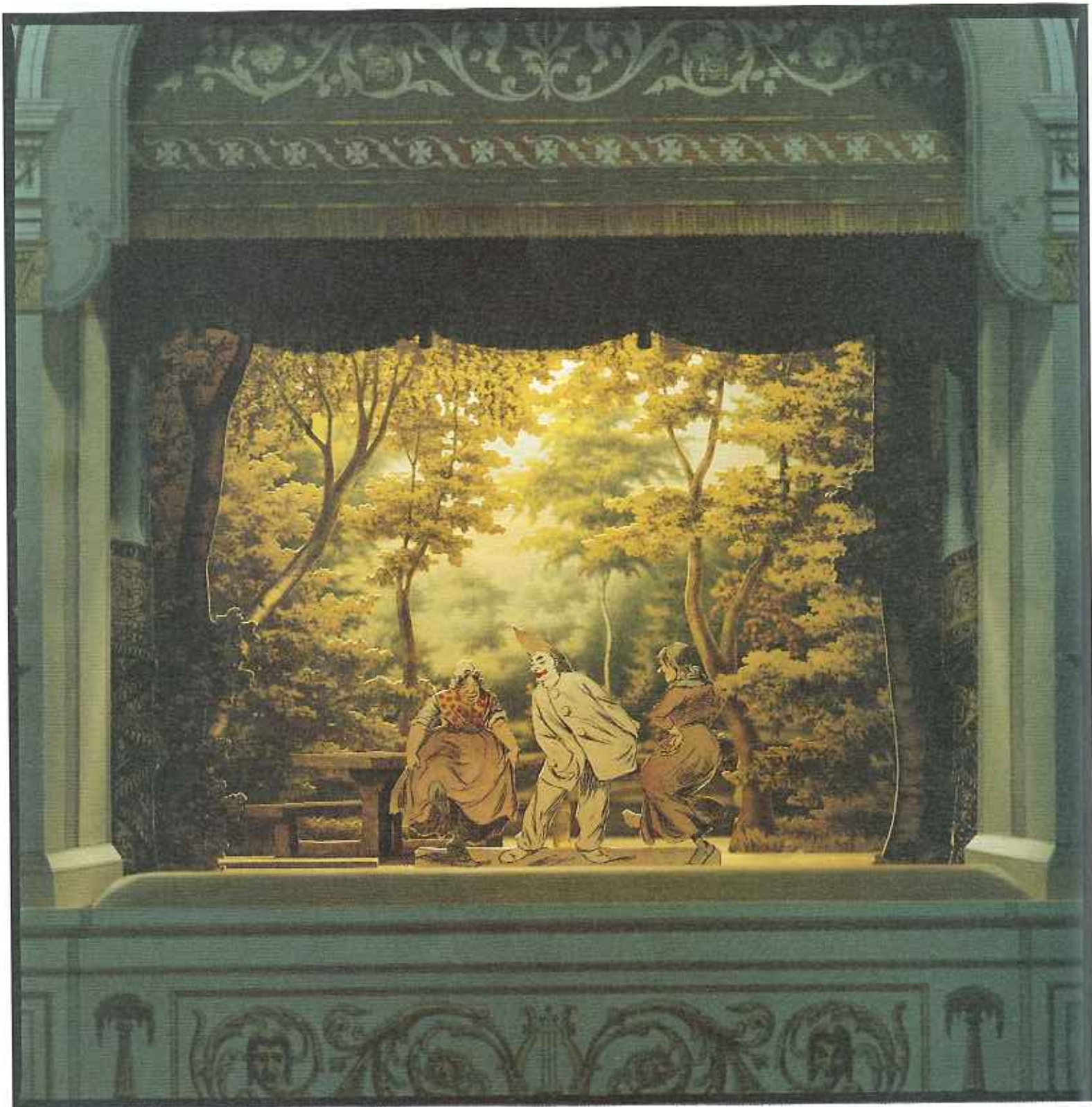
En dansk bokskog från 1880-talet i ett fantastiskt tryck, där varenda skugga, varenda nyans lever.

men pjäser för barn kom inte förrän på 1880-talet. Det var Snövit och andra sagospel.