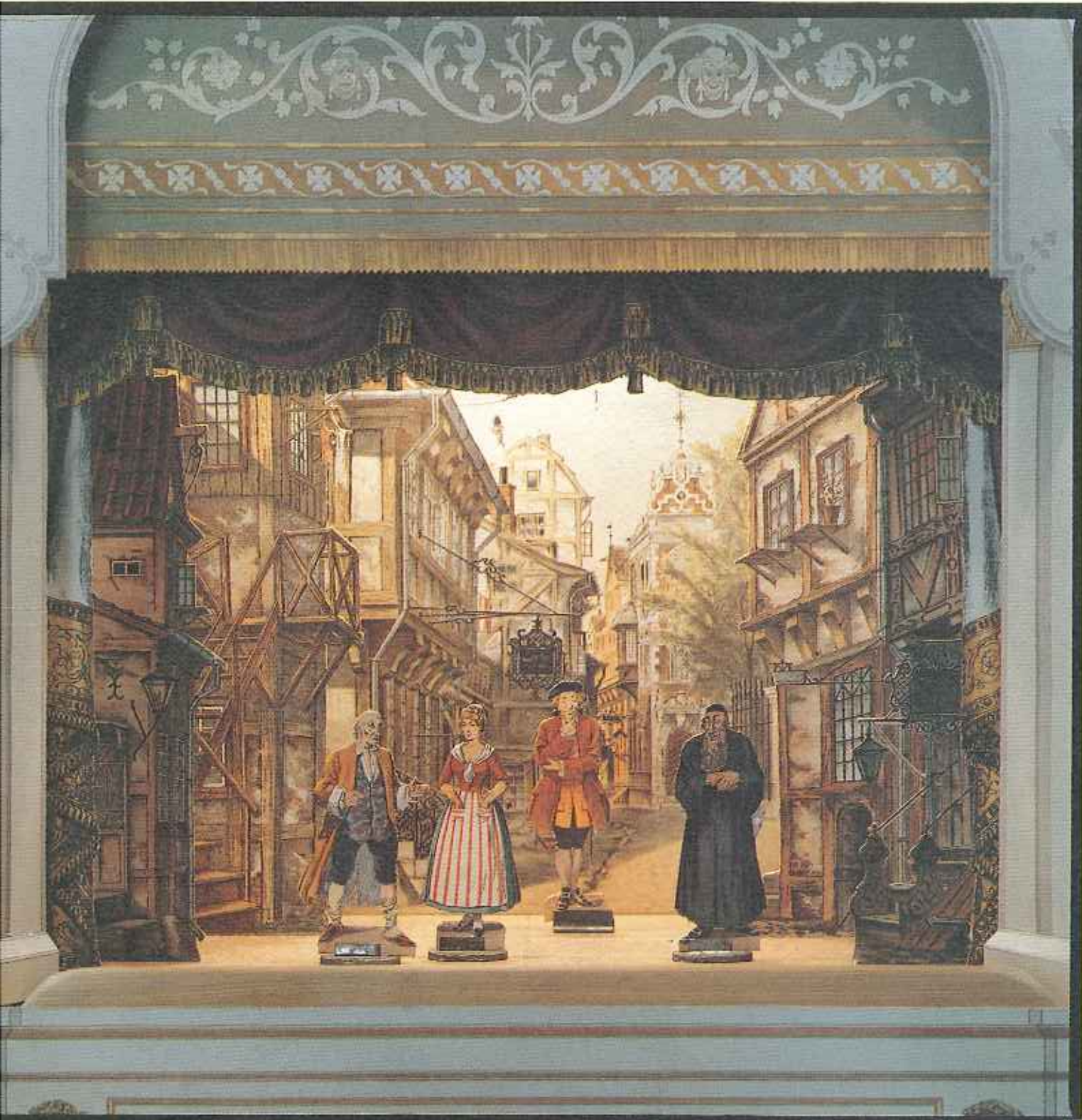
Här har vi ställt upp en gatubild från Köpenhamn. Bakgrunden och dekoren är från 1884.